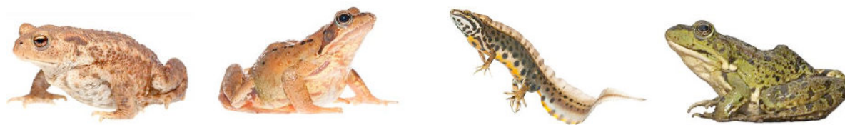
Figuur van links naar rechts. Gewone Pad (Bufo bufo) / Bruine Kikker (Rana temporaria) / Kleine Watersalamander (Lissotriton vulgaris) en Groene Kikker (Pelophylax)

Padden hebben op het land een droog en zacht aanvoelende huid die er wrattig uitziet. Kikkers voelen vochtiger aan en hebben een veel gladdere huid. De kikkers die wij tegenkomen zijn meest bruine kikkers , want groene kikkers trekken minder en later in het jaar. Kikkers hebben veel langere en steviger achterpoten dan padden. Bruine kikkers (en heikikkers) herken je ook aan de grote donkerbruine vlek achter het oog.