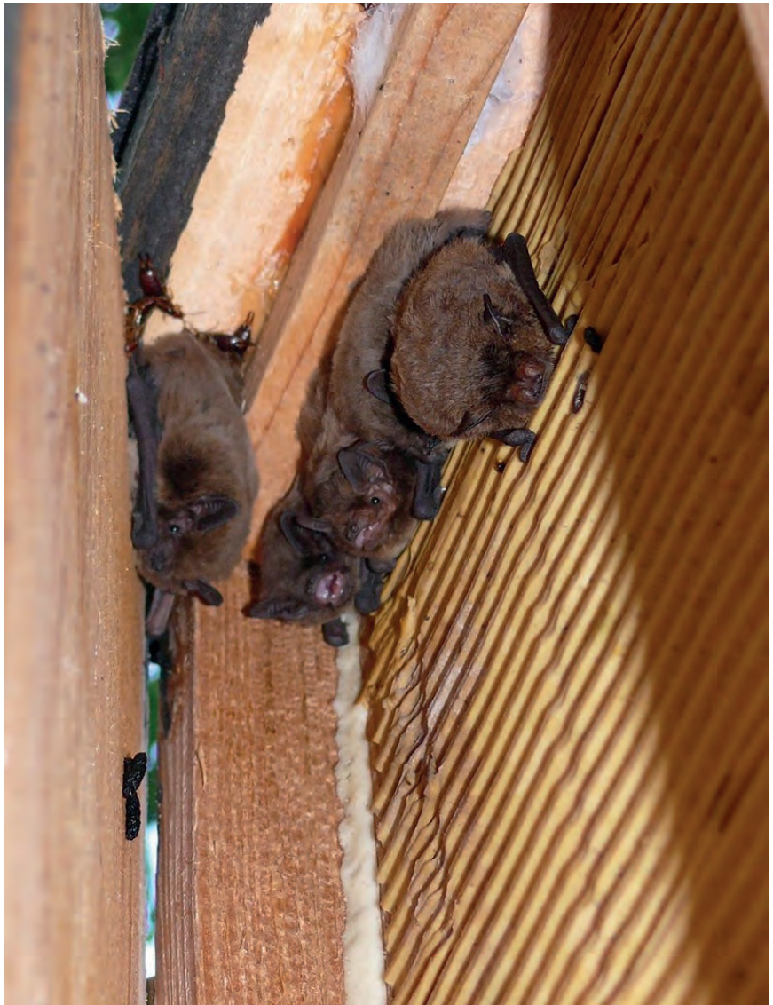
Ruige dwergvleermuizen in een kast in het Lingebos.

Je kunt je ook nu al aanmelden als vrijwilliger bij: info@liniewacht.nl