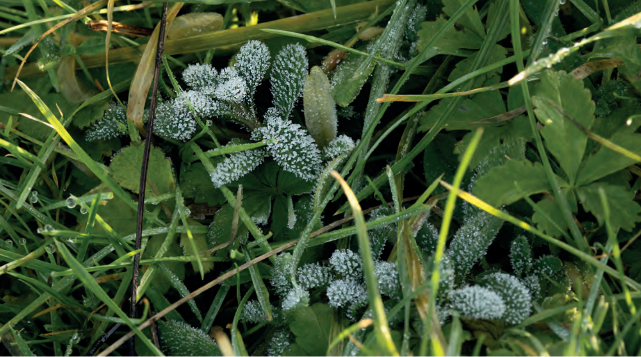
Koude ochtend! Wat doet denken aan wilgenkatjes, zijn in werkelijkheid berijpte blaadjes van moeras- of zompvergeet-mij-nietje. Verder zichtbaar: vijfvingerkruid en ruw beemdgras.

Op en langs de waterplas zien we veel watervogels zoals fuut, aalscholver, blauwe reiger, grote zilverreiger, grauwe gans, smient, wilde eend, krakeend, tafeleend, kuifeend, brilduiker en meerkoet. Koos laat iedereen door zijn telescoop meegenieten. We ronden het zuidelijke uiteinde van de plas en gaan door een klaphekje. Hier begint de landengte tussen de Vonkerplas en de Waal met de zon achter ons. Veel uitgebloeide kaardenbollen, sommige wel 2 meter hoog, dus speuren we naar de distelvink (putter) maar zien ze niet. Het is een