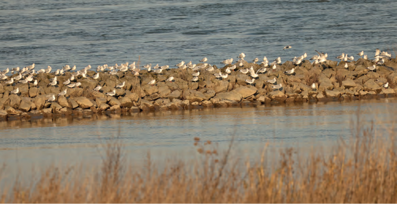
In de Waal zijn veel kribben vervangen door langsdammen, hier met meeuwen.