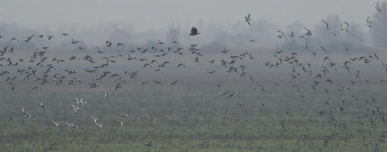
Alles gaat de lucht in als de zeearend in de buurt komt.

Hier ontmoet je altijd andere vogelaars en moet je zijn voor het laatste vogelnieuws. De bekende kuddes edelherten, hekrunderen en konikpaarden op grote afstand maar ook vijf nonnetjes op een plas, torenvalk en drie zeearenden. Jules vindt met zijn telescoop nog een slechtvalk zittend op een molsloop als uitkijkpost. Een andere vogelaar met een telescoop ziet een roodhalsgans tussen de brandganzen, maar wij kunnen hem niet vinden.