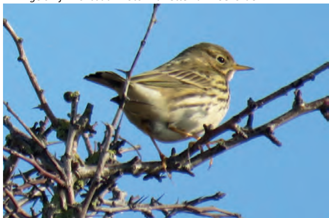
Graspieper in een meidoorn. Beide achtereena-gels zijn zichtbaar.

Nog even doorstappen en we zijn weer terug bij mannetje brilduiker . Op dezelfde plek, maar nu met meerdere fotografen. Aan de waterkant hinkt een hert, die maakt het niet lang meer, is de conclusie. Wij zijn vandaag niet over de herten gestruikeld, hebben er zijdelings vier gezien, maar daar kwamen we ook niet voor. Toch zijn we dik tevreden met de circa 30 soorten (water)vogels die we hebben bewonderd. En, zoals een wijze deelnemer zei: "Wij zien veel dieren, maar veel meer dieren zien ons." Toch benieuwd hoe hun waarneming van ons zou zijn!