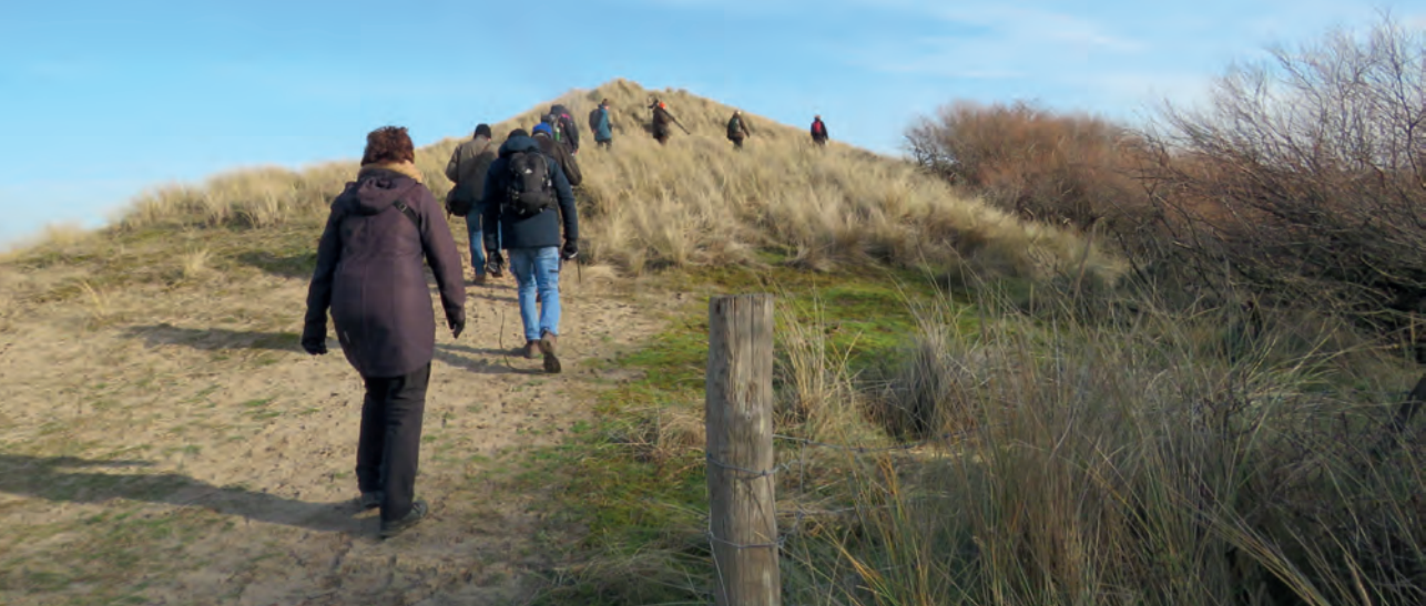
De excursiegangers beklimmen een duintop.

We lopen door mooi duingebied. In het uiterste topje van een struik zit een roodborsttapuit . In de duinen horen we wat piepen en zien we iets naar beneden fladderen. Een pieper is de conclusie, maar welke? Duin-, oever-, water-, boom- of graspieper? Even later boven in een stekelige struik zit een tweetal even stil. Streepjes op de buik, beetje kleur op de flanken. Onze Zakgids Vogels houdt dit voor een graspieper. Als ik later inzoom op m'n fotocamera zie ik die lange achternagel, waar hij goed aan te herkennen is. Grappig dat hij in een struik zit met allemaal lange dunne doorns, sprekend lijkend op zijn achternagels.