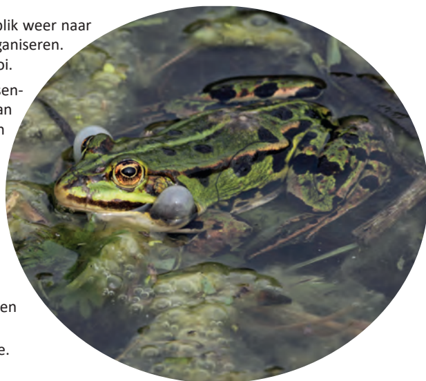
Groene kikker.

En wie behoefte heeft aan een andere natuuractiviteit, op een ander moment, mag contact opnemen. Zie ook onze website.