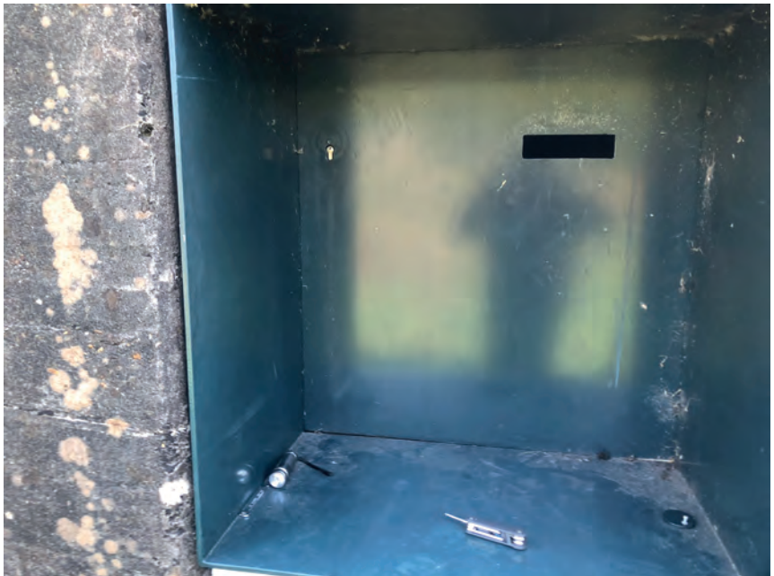
Groepsschuilplaats aan de Diefdijk, ingericht als winterverblijfplaats voor vleermuizen.

spouwmuren, vooral van huizen uit de jaren '60 en '70. Daar veroorzaken ze geen problemen, alleen als je het huis wilt isoleren en verduurzamen moet je maatregelen treffen, de vleermuis is bij wet beschermd." Roel: "Dan komt de gemeente om de hoek kijken, ze helpen met vergunningen." Over helpen gesproken... de gemeente Vijfheerenlanden heeft dit jaar op de Open Dag van de Natuur en Vogelwacht maar liefst 180 vleermuiskasten, gemaakt door enthousiaste vrijwilligers van deze club, aan inwoners uitgedeeld. Wat dat in de toekomst gaat opleveren is nog ongewis, maar voor nu al wel twee nieuwe vrijwilligers voor de Liniewacht.