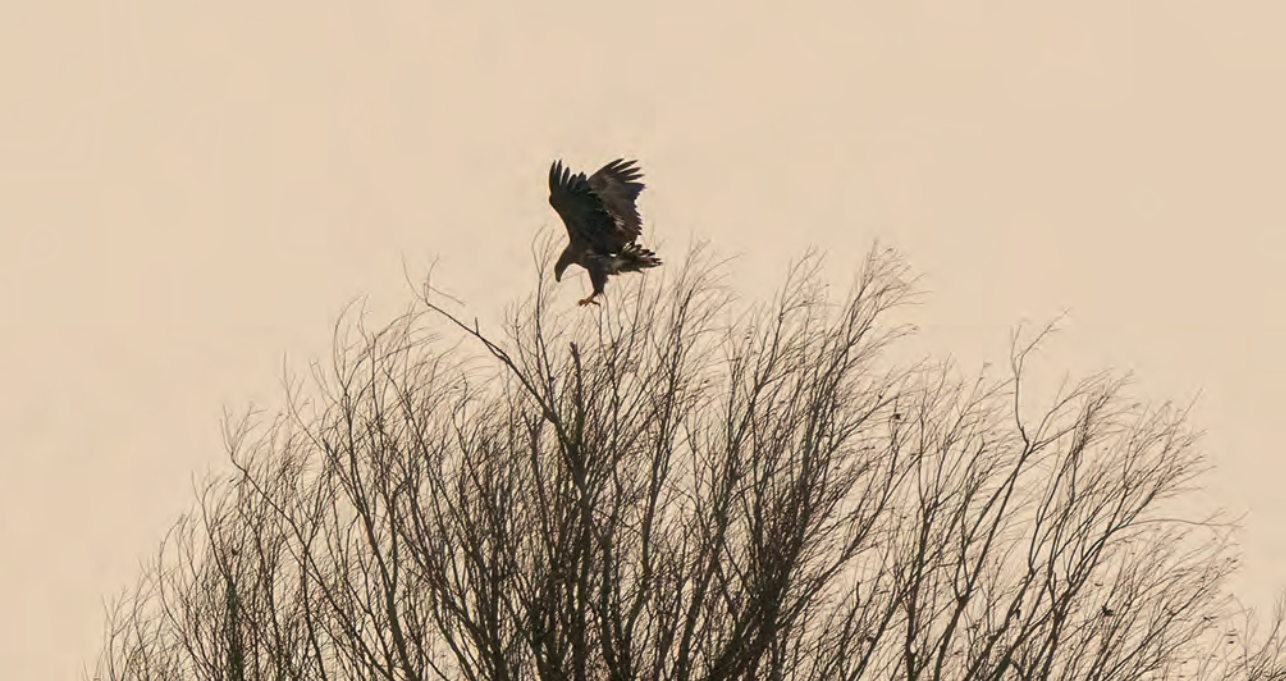
Zeearend zet zich op een boom.