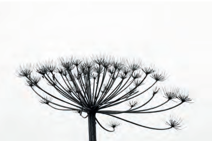
Boven: echt judasoor en reuzenberenklauw. Onder: geweizwam en fluweelpootje.