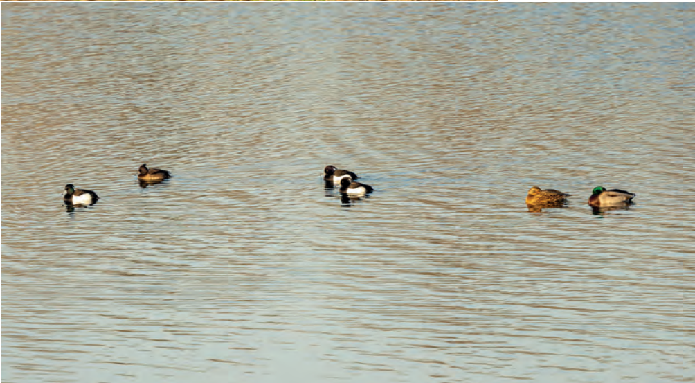
Kuifeenden en wilde eenden.