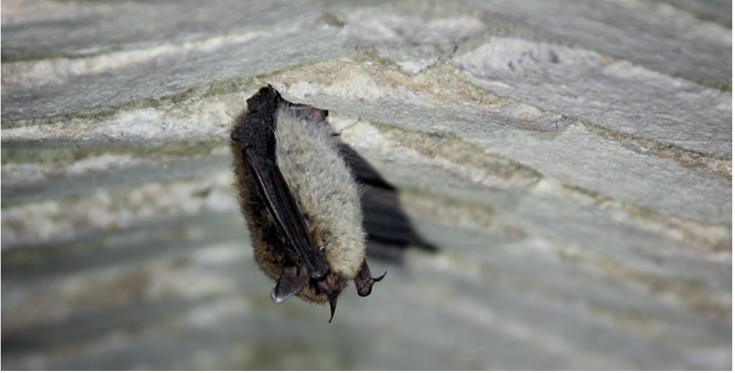
Baardvleermuis in winterslaap in een oven in Fort Vuren.

tussen. Wie ook in hetzelfde winterverblijf in winterrust gaan zijn vlinders zoals dagpauwoog en, in mindere mate, kleine vos. Bij forten overwinteren ook hele bergen Aziatische lieveheersbeestjes in veel varianten met allerlei kleurtjes. Ook roesjes (nachtvlinders) slapen hier hun roes uit. Ze hebben wel lef om zich zo dicht bij hun natuurlijke vijand te begeven." Wiegert: "Als je ergens roesjes ziet hangen, dan weet je bijna zeker dat die ruimte klimatologisch ook geschikt is voor vleermuizen. Vleermuizen nemen de omgevingstemperatuur aan. Die zakt nooit onder nul, want ze overwinteren altijd in vorstvrije ruimtes, hier in de omgeving vooral in forten en bunkers. De meeste vleermuizen zitten in