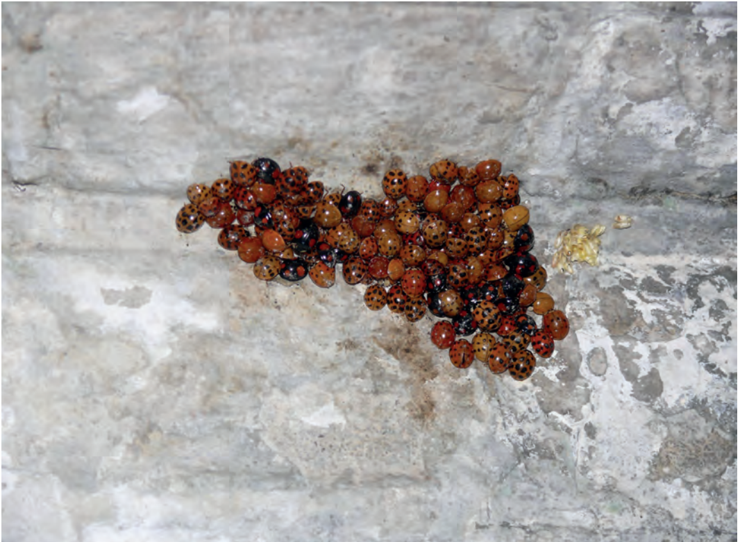
Aziatische lieveheersbeestjes overwinteren ook in de forten en bunkers van de Nieuwe Hollandse Waterlinie.

en hangen schalen/dakpannen op. Daarna mag gedurende een halfjaar, van oktober t/m maart, niemand in de winterverblijven komen. Alleen als vleermuisvrijwilliger mag je dan één keer zo'n bunker binnen om te tellen." "Dat doen we als ze nog in winterrust zijn, in februari", gaat Wiegert verder. "Het duurt enkele minuten voordat ze echt wakker zijn, dan beginnen ze te bibberen. Dit kost veel energie, dus vaker verstoren doen we zeker niet. Dat zouden ze niet overleven. Deuren hebben dan ook een slot erop tegen verstoring van mensen."