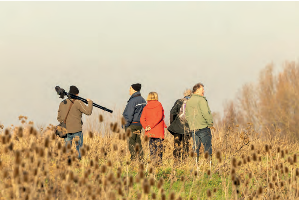
Tussen de kaar- denbollen op de zomerkade langs de Waal.