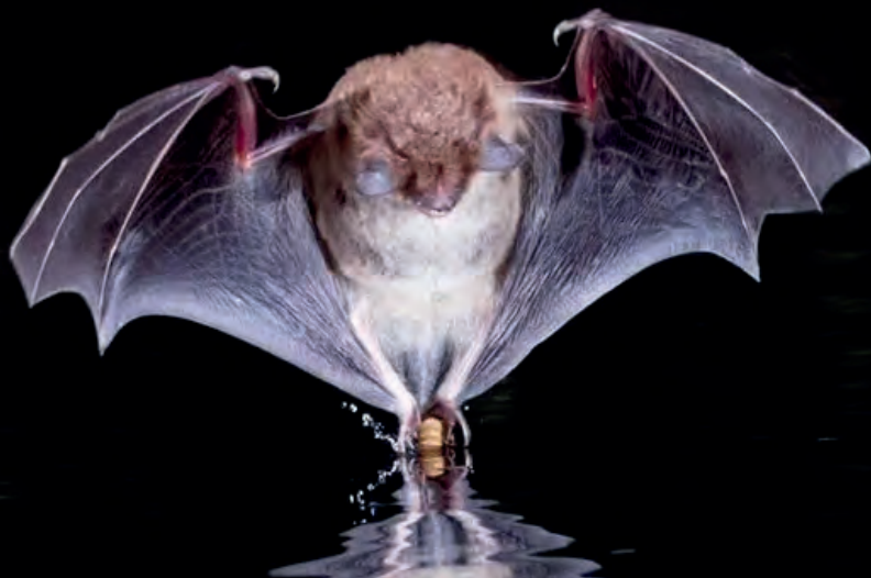
Jagende watervleermuis.