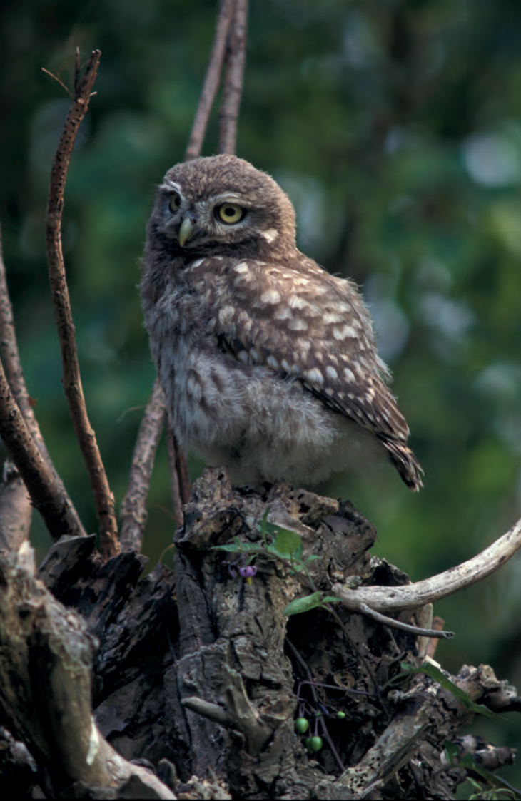
Dit steenuiltje is in juli 1995 gefotografeerd op een prachtige houtkade: de Zijpkade tussen Helsdingen en Lexmond.

uil allemaal gegeten heeft! Veel kinderen vinden in delen een bijna compleet skeletje van een muis, echter te teer om in elkaar te zetten. Veel botjes zijn zo dun als de graatjes van een vis. Een kind roept: “Deze uil had een goede nacht, in mijn uilenbal zitten wel drie schedeltjes!”