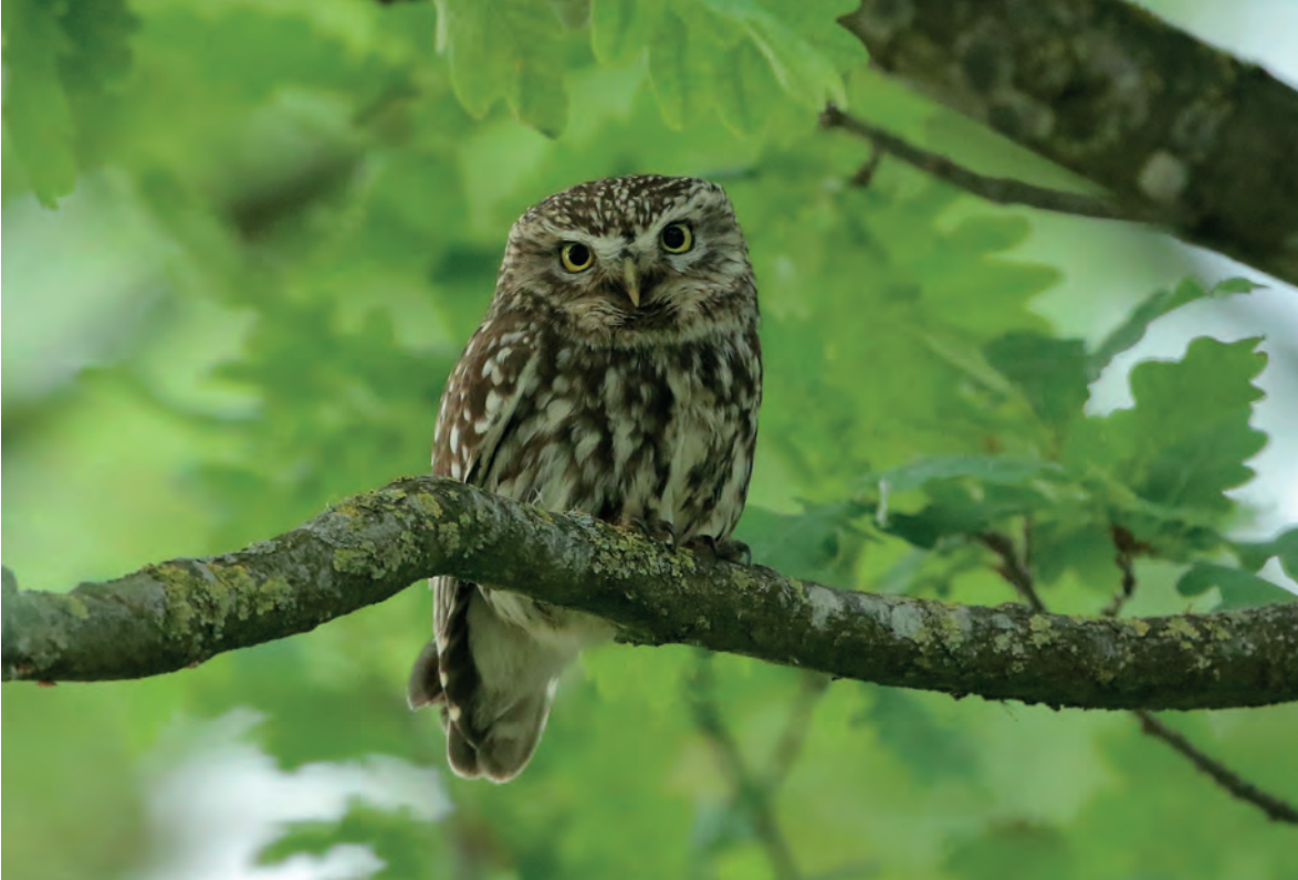
Steenultje op een boomtak.