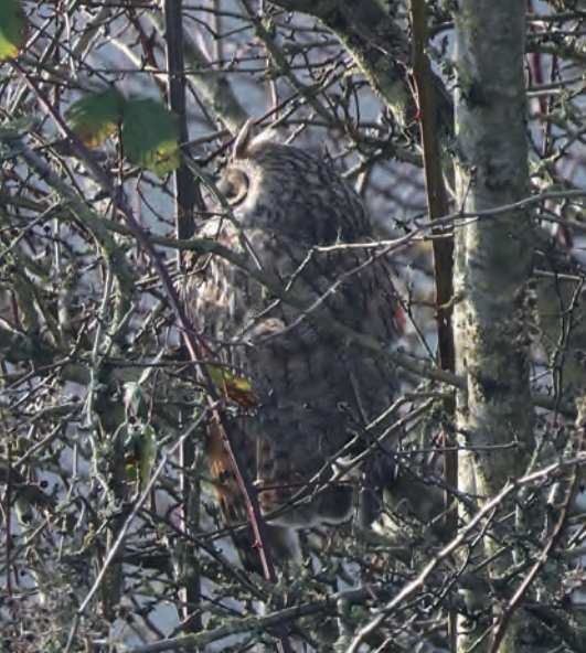
Een van de ransuilen.

ter fort Everdingen is daar een mooie plek voor. Hier missen we de Chat GPT vogel vandaag. Heeft iemand deze Cetti's zanger elders nog gehoord? Dit vereist enige verduidelijking. De zang van deze rietbewoner bestaat uit een explosieve uitbarsting van abrupte tonen, tsjie-tsjewietsjoe-wietsjoe-wietsjoe-wie. Met een beetje kinderlijke fantasie weergegeven als chat-gpt-chat-gpt-chat. De zang wordt vaak door menselijke stemmen, onweer of verstoring op gang gebracht.