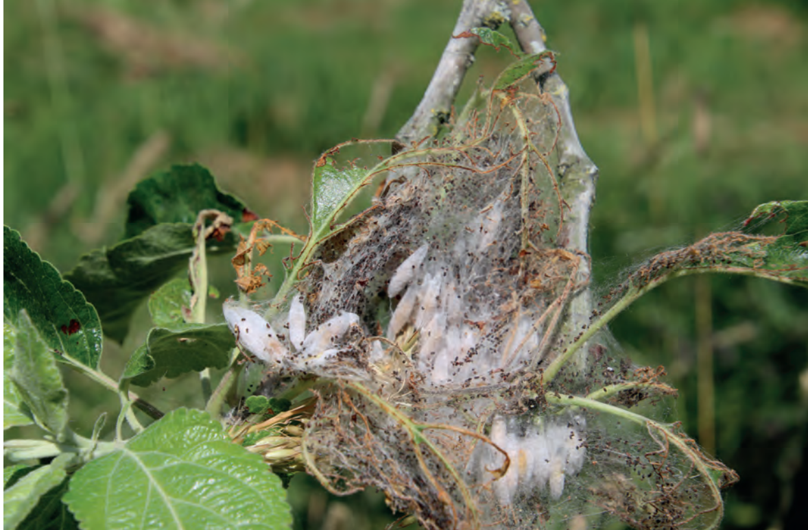
Een nest van de appelstippelmot ( Yponomeuta malinellus ) met poppen en vraatzuchtige rupsen.