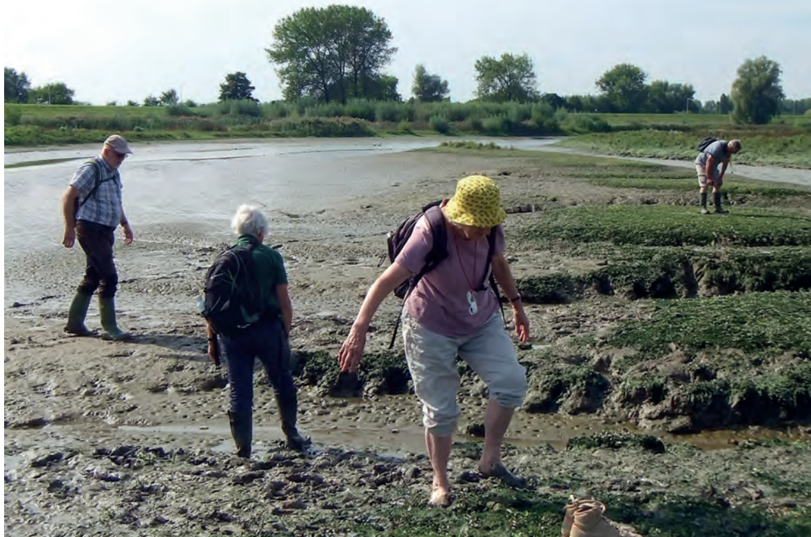
Op zoek naar pionierplanten van het zoetwatergetijdgebied in ZHL-reservaat het Kerbergsrak langs de Lek bij Lexmond. Een glibberig karwei!

echter gedaan voor Waterschap Rivierenland. Met het Waterschap is overeengekomen dat de Plantenwerkgroep de ontwikkeling van de vegetatie in het nieuw ingerichte waterbergingsgebied Vierhoeven aan de Bolgerijsekade zal uitvoeren. In 2023 is volgens verschillende methoden (Tansley-opnamen, stippenkaarten en Braun-Blanquet-opnamen) de huidige vegetatie in kaart gebracht. Als Plantenwerkgroep hebben we het geluk met Dick Kerkhof iemand in huis te hebben met veel kennis van inventarisatiewerk en vegetatieopnamen. De kennis van de flora wil het Waterschap gebruiken voor de wijze van beheer van het terrein.