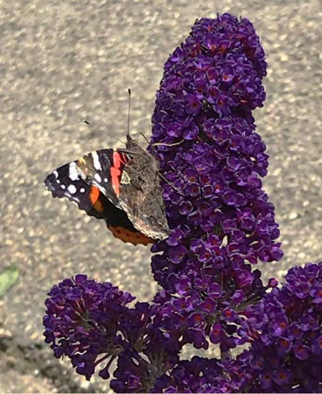
Atalanta op mijn vlinderstruik.

voor die tijd en zeker ook heel bijzonder voor een vrouw in die tijd om zo'n studie te maken en daarover ook te publiceren. Meerdere boeken heeft ze uitgegeven, boeken die ook nu nog van grote waarde zijn, niet in het minst om de prachtige illustraties.