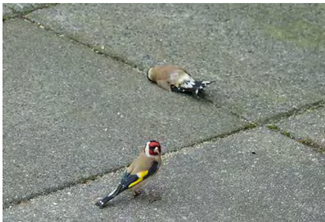
Puttertragedie in Leerbroek.

Men is begin dit jaar gestart met de nieuwbouw van het dorps huis. Daar op het parkeerterrein stond een boom met een dichte kruin vol huismussen die weggehaald is. Zij zijn kennelijk de wijk ingetrokken en hebben o.a. onze tuin, met kippenren, ontdekt. Toen wij doorkregen dat ze graag de restjes opaten