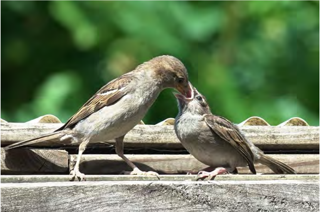
Een jonge huismus wordt door zijn of haar moeder gevoerd op de kippenren.

Hieronder vindt een huismusvrouwtje iets smakelijks op of aan een exemplaar beklierde basterdwe- derik (determinatie: Dick Kerkhof). Een bloemknop, iets dierlijks, of allebei?