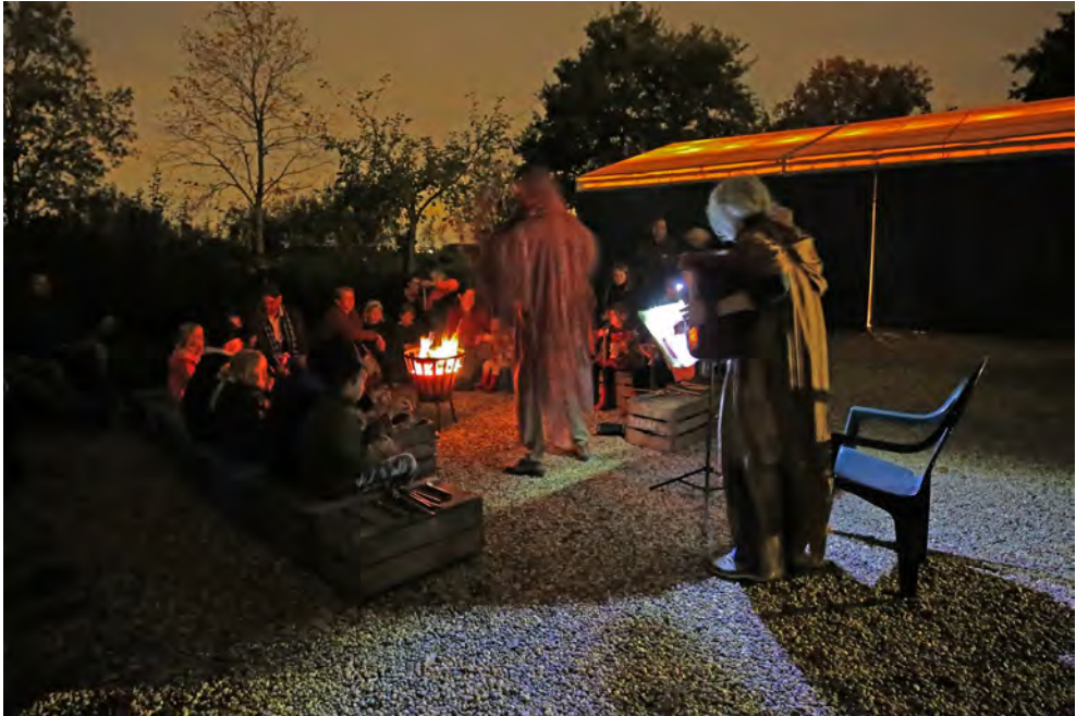
Spookachtig tafereel tijdens de Nacht van de Nacht.

waarden Lek en Diefdijk, noch de Linge en haar omgeving, de Bolgerijense polder, de Huibert of Scharperswijk benoemd, die alle deel uitmaken van het Natuurnetwerk Nederland. Het bestuur heeft samen met Den Hâneker en het Zuid-Hollands Landschap in