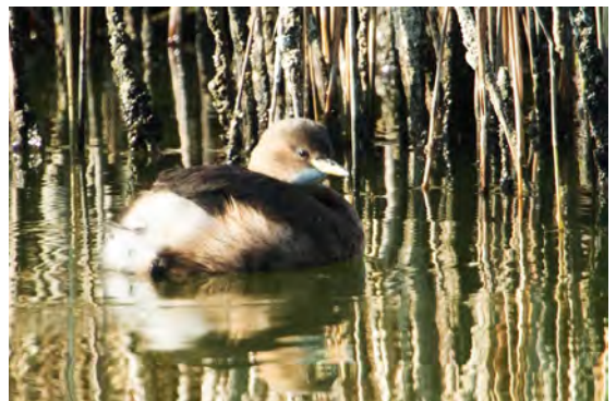
Dodaars