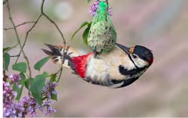
Grote bonte specht.

Aanmelden: Vooraf aanmelden is noodzakelijk bij C. Kramer, tel.: 0345-619684 of e-mail: ckramer01@hetnet.nl