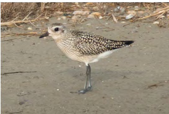
Zilverplevier