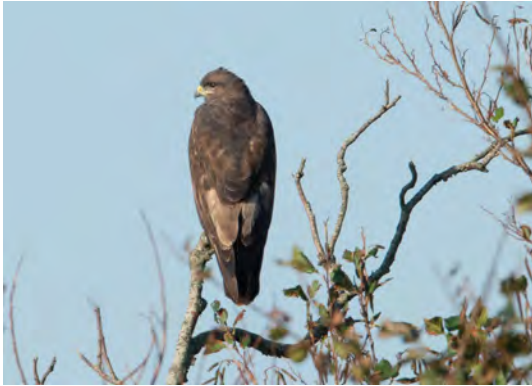
Blauwe kiekendief

We eten vandaag restjes boerenkool en kip met frites (Cees).