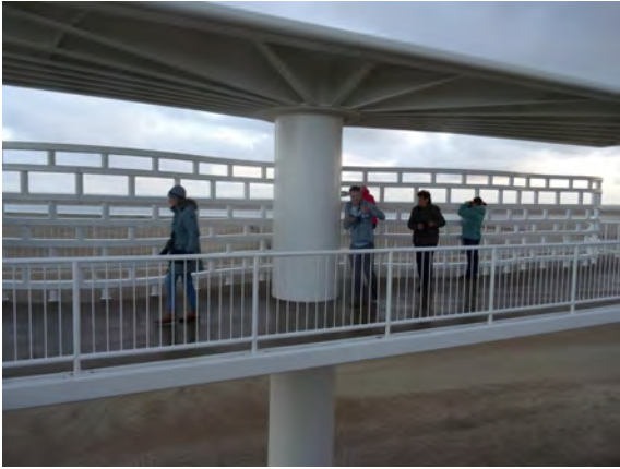
De Schans

Maandag 28 okt, vandaag doen we nog een keer het rondje naar de Vuurtoren, als het water zakt zijn hier veel vogels op het wad te zien, zoals rotganzen, slobbeenden en zilvermeeuwen. Bij het kijkscherm naast De Robbenjager zitten weer de watersnippen, in de lucht bidt een torenvalk. Daarna rijden we naar een nieuw gebied bij het Prins Hendrik-gemaal, waar we weer een aantal watersnippen zien. Langs de dijk richting Oudeschild is er ook een nieuw gebied in aanleg met bij de Waddensee een betonnen monument, bij de Schans, zie foto.