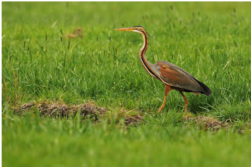
Baardman (vorige pagina) en purperreiger (boven).

een goede leefomgeving om te foerageren en te broeden. Dat betekent vooral voor de zangvogels de nodige rust en bescherming. In deze lezing dus ook veel aandacht voor deze zomergasten zoals rietzanger, blauwborst, snor, kleine karekiet en rietgors.