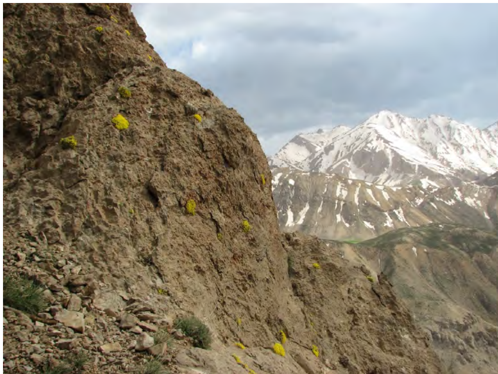
groeiplaats van Dionysia hausknechtii in het Zagrosgebergte.