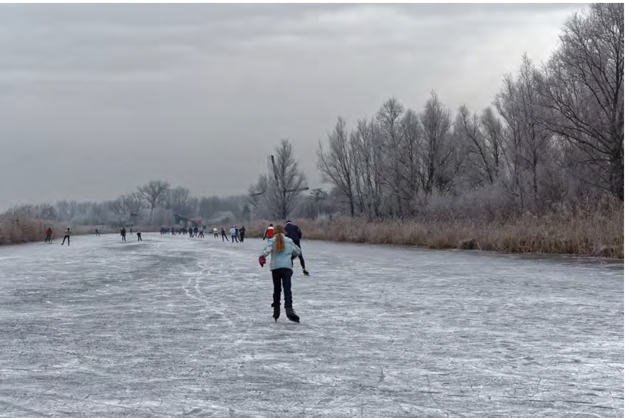
Zouweboezem met schaatspret