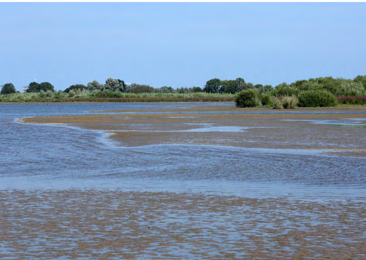
Van bouwland naar wetland.

Werkt sinds de jaren '70 bij Staatsbosbeheer. In het begin werkte hij op het Haringvliet, Hollandsch Diep en het Krammer-Volkerak. In zijn loopbaan heeft hij veel zien veranderen