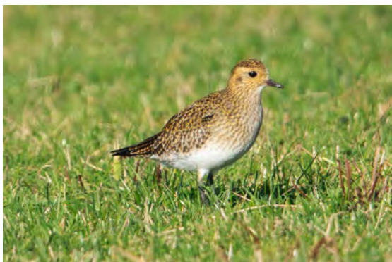
Goudplevier