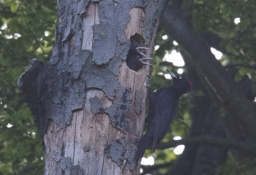
Zwarte specht met jongen.

Veluwe. Een heel ander landschap dan de polders om ons huis. Tijdens een van onze wandelingen daar stuiten we op een groep mannen die met enorme toeters van telescopen naar boven turen. Wat is daar te zien? We zien vier of vijf dode beukenbomen met een groot aantal gaten erin.