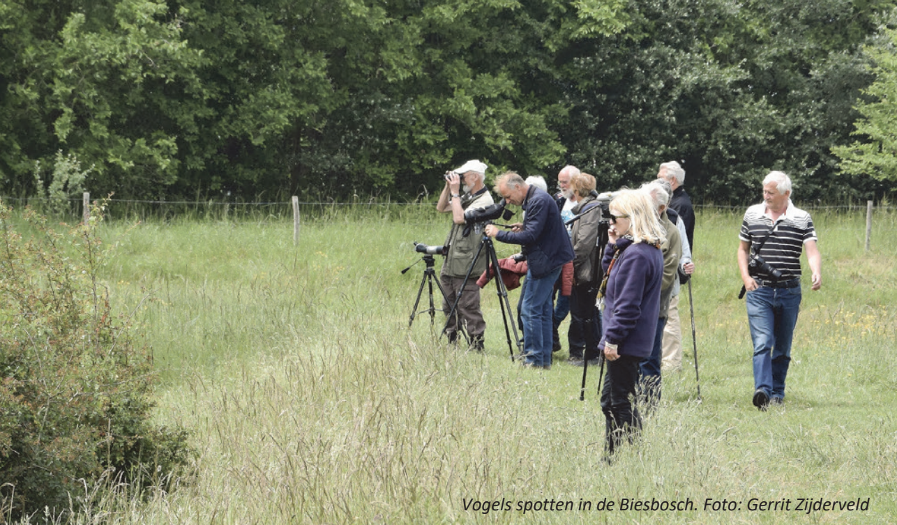
Vogels spotten in de Biesbosch.