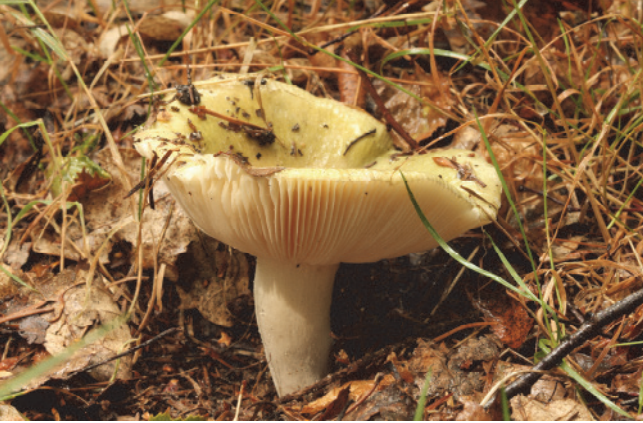
Groene berkenrussula .

Sommige soorten zijn gebonden aan loof- of naaldbomen, andere hebben meer een voorkeur voor bomen (loof- of naaldbomen) op een bepaalde grondsoort.