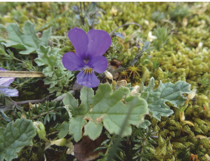
Bleeksporig bosviooltje. Ook op de foto: blad van jakobskruiskruid en geel walstro, duinklauwtjesmos en groot duinsterretje.

trum aan het begin zijn. Onderweg zit er nog een roodborsttapuit in een struik en vliegt er een vlinder langs, het oranjetipje.