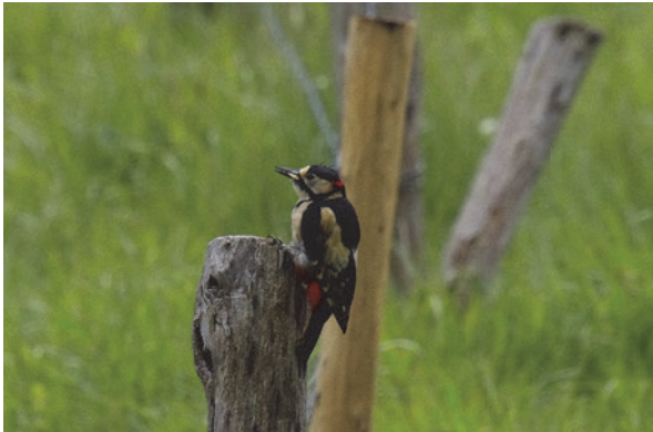
Grote bonte specht.

Een vreemde titel voor een artikel in het zomernummer van De Dompfoorn hoor ik u denken. Nou, dat ben ik niet helemaal met u eens, want achter ons huis wordt druk geklopt in de boom. Al weken wordt er geklopt en getimmerd. De arbeider heeft een zwart met witte jas, een witte buik en borst en een rode broek.