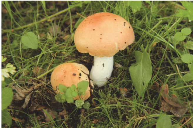
Viermaal kleibosrussula. Hieronder zijn ook de plaatjes zichtbaar.