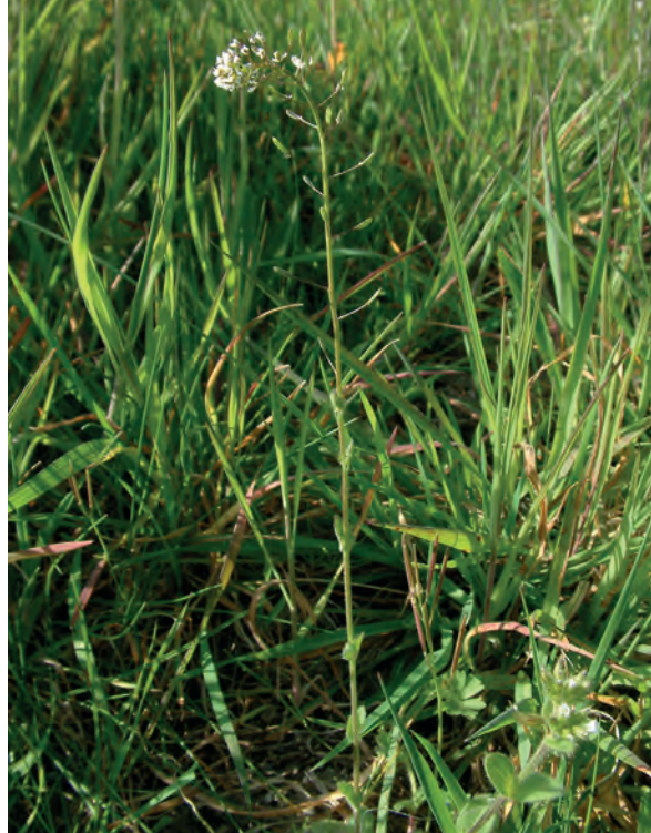
Links: verspreiding per km-hok. Rechts: wit hongerbloempje op talud van knooppunt Everdingen.

daan? Mogelijk van de standplaats. Het wit hongerbloempje groeit namelijk goed op open, wat uitgehongerde grond. Talrijk optreden werd vroeger gezien als een teken van hongersnood of in ieder geval dat de grond ongeschikt was om iets op te verbouwen.