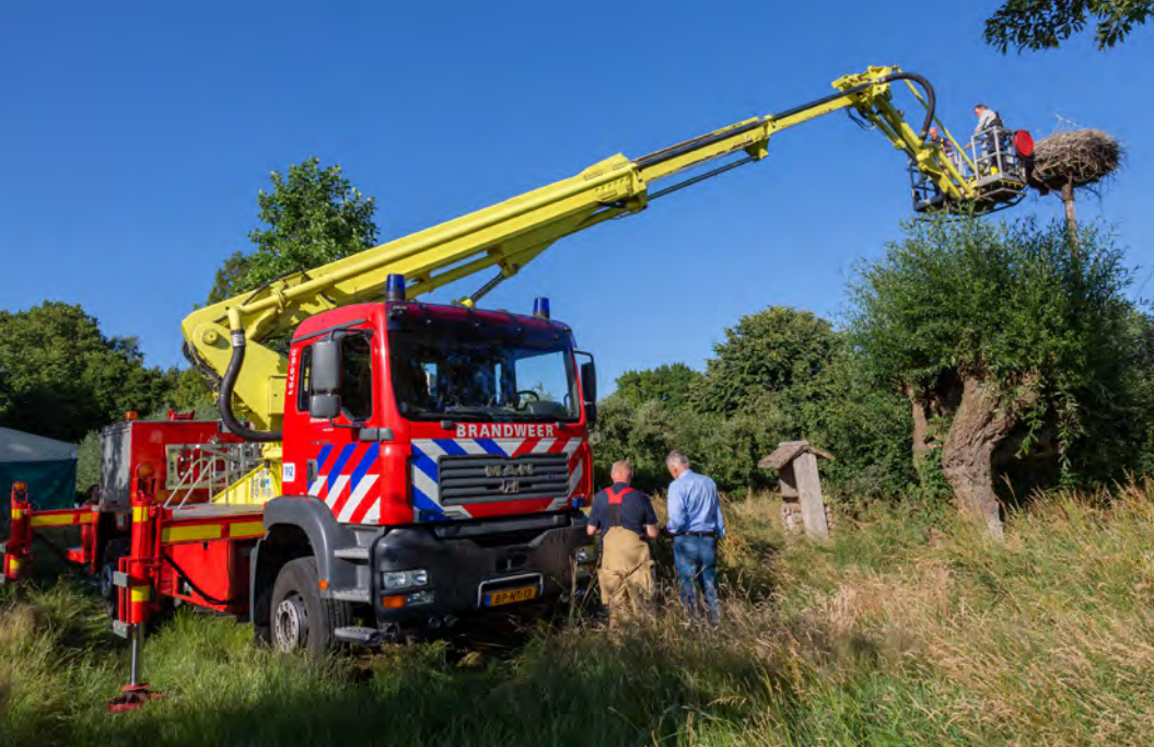
Brandweerkorps Vianen en Arie in actie. De ooievaars hebben inmiddels door dat het om hen gaat.

Helaas moest dit door brandweerteam Leerdam worden afgeblazen i.v.m. groot onderhoud aan de hoogwerker. Maar woensdag 15 juni gaan we wel op pad met brandweerteam Vianen, we gaan naar het gemeentehuis op de Voorstraat. Daar op 18 meter hoogte zitten twee al grote jongen op het nest. Dit had ik enkele dagen eerder al gezien.