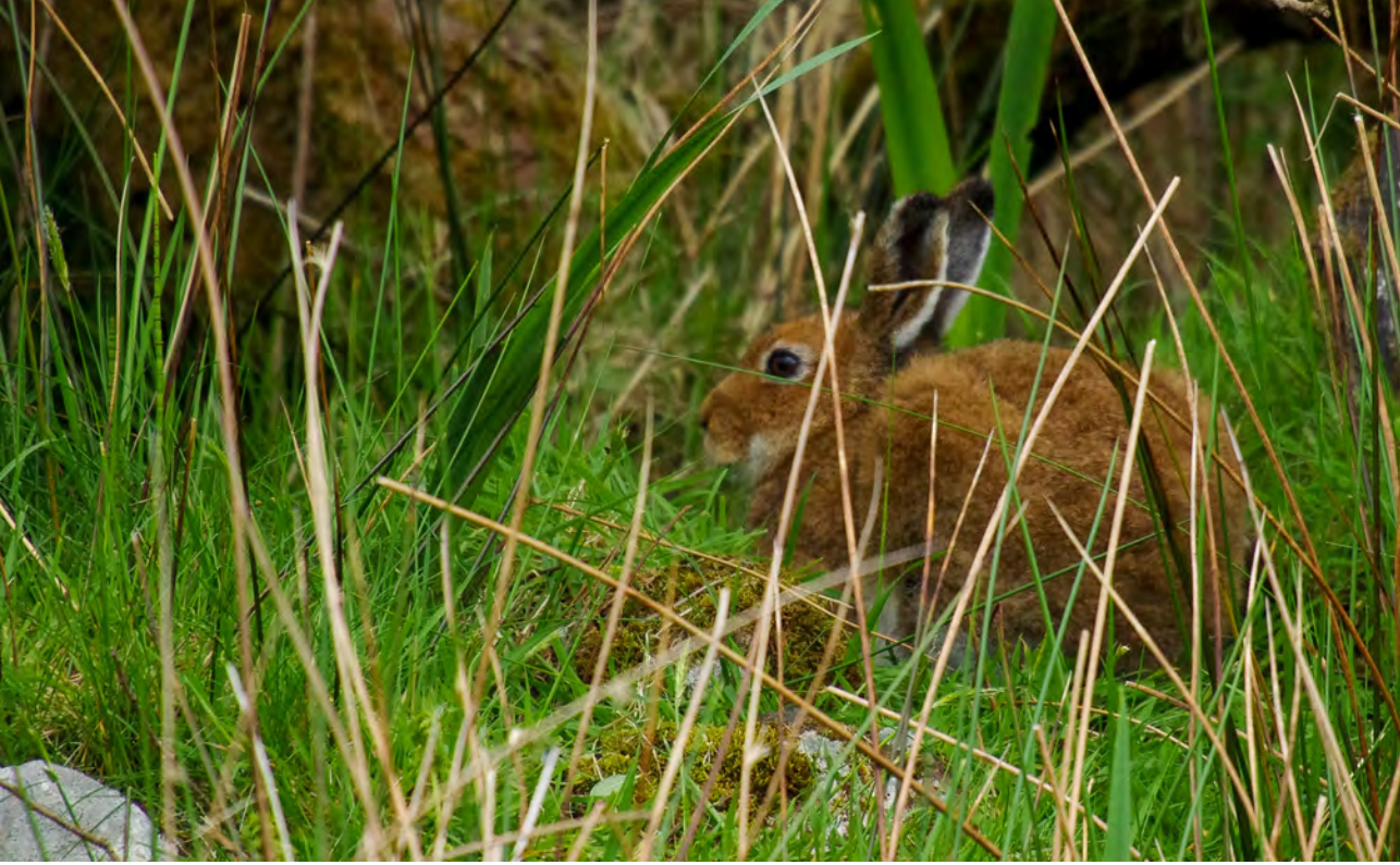
Ierse haas.

dat het tijd was geworden om aan de slag te gaan met wat ik had geleerd: met zelfvertrouwen een andere koers gaan varen, eerlijk tegen mezelf durven zeggen: het was mooi die baan, maar nu is het wel genoeg en vooral ook dat laatste gaan leren: luieren (misschien maar af en toe). Het werd hoog tijd voor een andere droom.