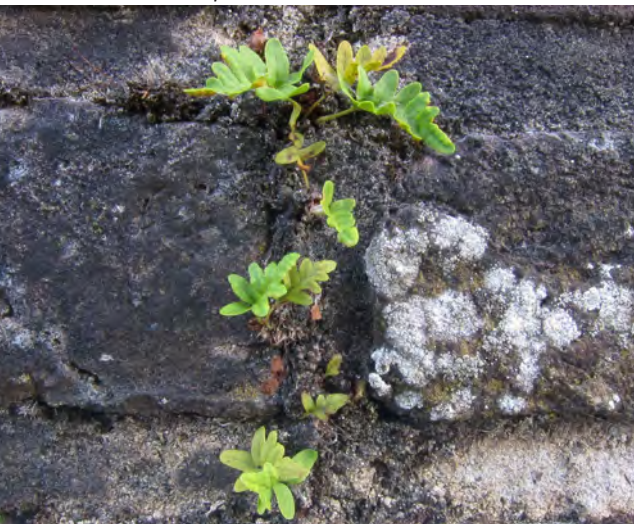
Eikvaren op de stadsmuur.