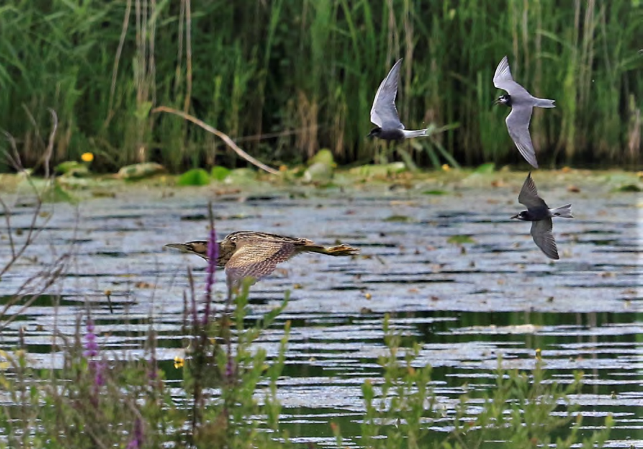
Roerdomp, geëscorteerd door een luchtmacht bestaande uit drie zwarte sterns.