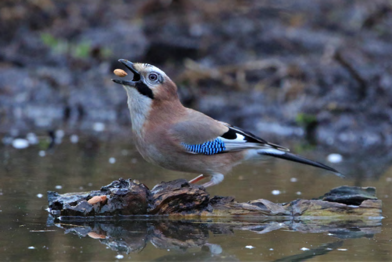
Gaaien zijn handig. Of moeten we zeggen: ze zijn heel goed gebekt?