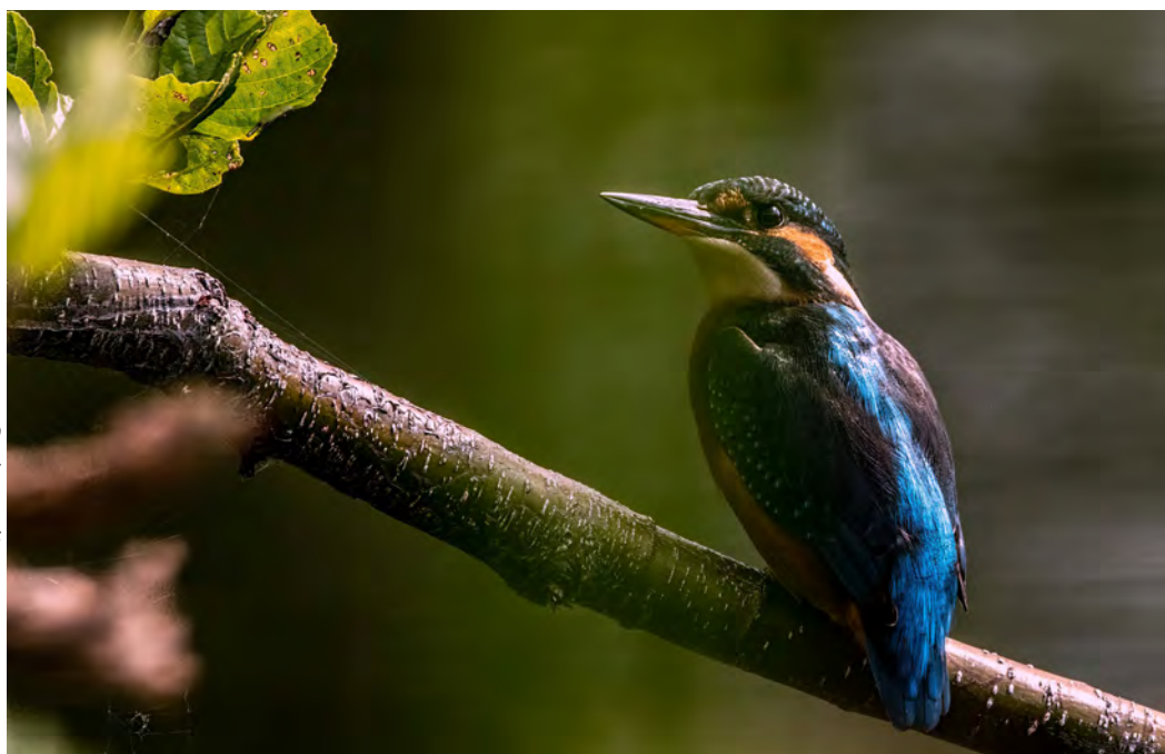
Ijsvogel op een elzen-tak.

Als dan op een tak net boven het water de ijsvogel je rustig opwacht. Dan is de droom compleet. Ergens in de afgelopen paar weken, ergens tijdens een zwoele zomeravond, tijdens het doelloos, lui drijven zat dat prachtige vogeltje op die tak. Hij leek te vragen: "Ruil je mij nu in voor een papegaaiduiker?" Ik haastte me te zeggen: "Nee, nee, jij blijft mijn topper!" Hij knikte afgemeten en vloog weg. Ja, papegaaiduikers zijn prachtig, maar de ijsvogel is meer dagelijkse werkelijkheid van hier.