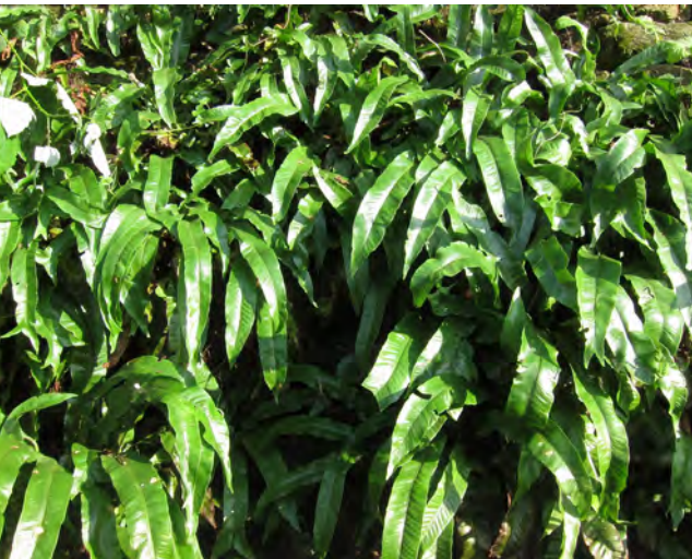
Enorme populatie tongvaren op een oude muur in de Hof van Brederode, de voormalige siertuin van Kasteel Batestein.