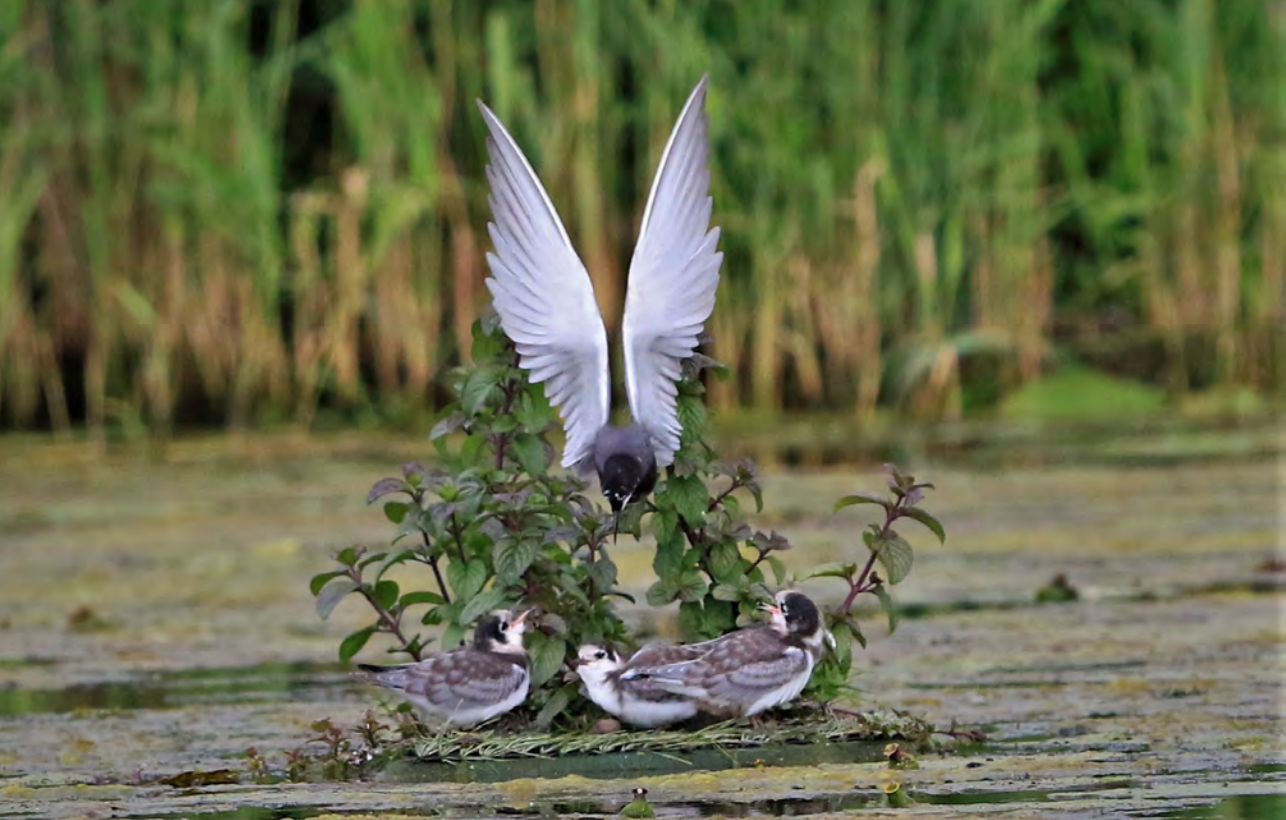
Oudervogel met al flinke pullen. Dit vlotje is rijk gemeubileerd met vitale watermunt.