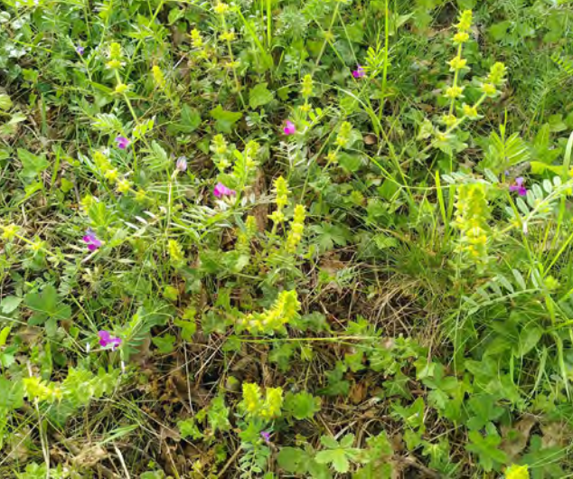
Kruisbladwalstro, peen, klimop, vijfvingerkruid en vergeten wikke in de berm van de Jan Blankenweg, aan de rand van bedrijventerrein De Hagen.