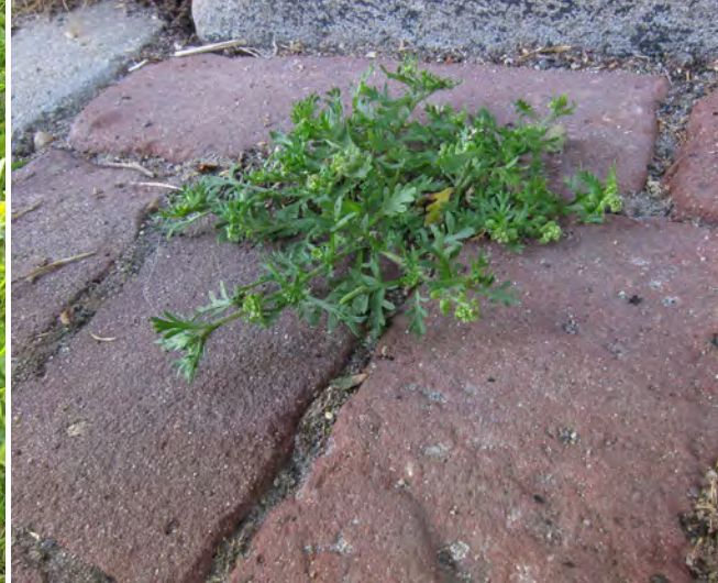
Kleine varkenskers heeft een plekje gevonden tussen klinkers op het Hofplein te Vianen.