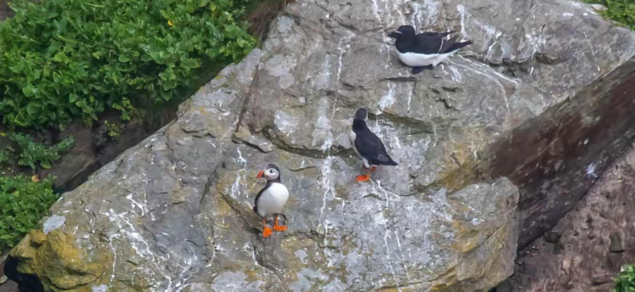
Papegaaiduikers. Hierboven zijn de opvallende oranje poten goed zichtbaar.

van onze belevenissen. Het was heerlijk dat het nog maar juli was. Normaal als wij terug kwamen van een langere vakantie was het september en bijna herfst. Nu was het op en top zomer. Dus ook thuis gingen we door met al die zomerse dingen: buiten eten, wandelen, luieren, lezen en.... zwemmen in De Wiel. Al die jaren dat ik hier woon in Schoonrewoerd had ik nog nooit gezwommen in De Wiel. Wat een prachtplek zo dichtbij. Genieten van de fuut, de eenden en ganzen. 's Avonds van de zwaluwen die laag over het water scheren en insecten vangen. Vaak is er bijna niemand anders in en bij het water. Als je je dan stilletjes terug naar het strandje laat drijven, de zon op