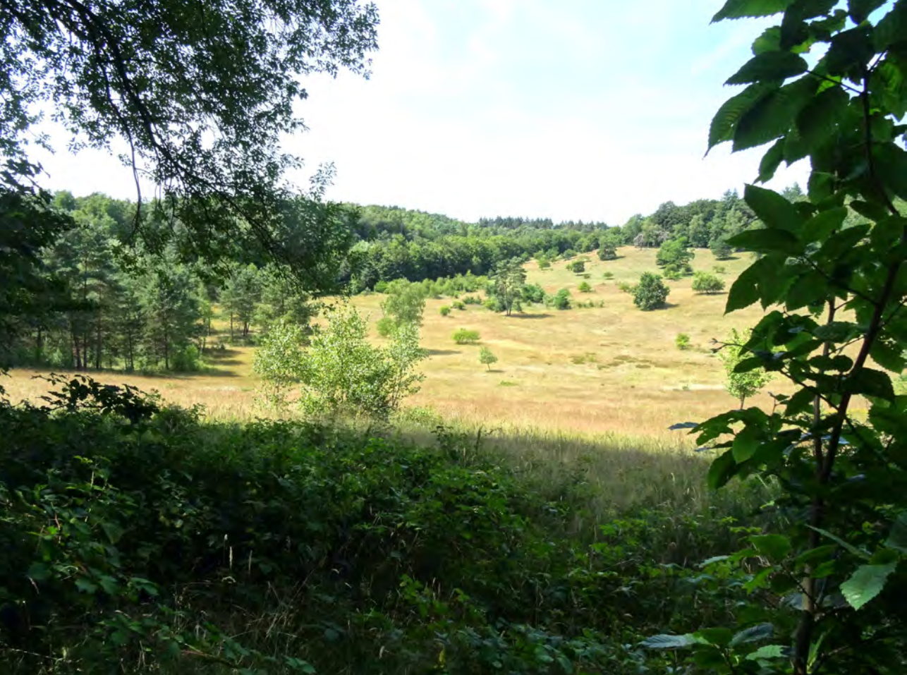
Uitzicht over landgoed De Paltz.

De volgende planten, vogels en reptielen hebben we gezien: