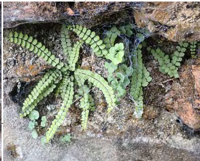
Steenbreekvaren, muurvaren en jong muurleewenbekje op de stadsmuur.