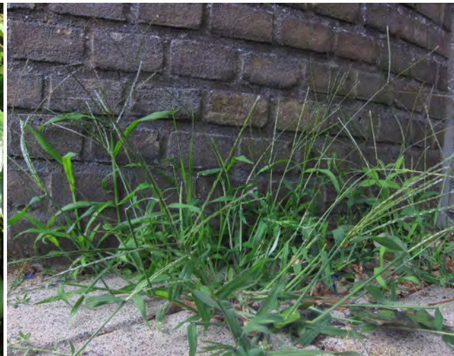
Harig vingergras, een C 4 -plant die profiteert van de opwarming van het klimaat.