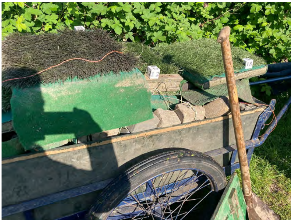
De vlotjes worden vervoerd naar de Linge.

Ook de weken daarna was er nauwelijks uitval. Eén keer kwam er een schildpad naast een vlotje met z'n kop en nek boven water. Ook dat gaf verder geen probleem voor de jongen. Een tiental verontruste ouders krijste er op los. Uiteindelijk zijn er 22 jonge zwarte sterns uitgevlogen! Geweldig toch. Inmiddels vertrokken ze allemaal, mogelijk naar de Markerwadden. Om zich daar voor te bereiden op de vliegreis naar West-Afrika.